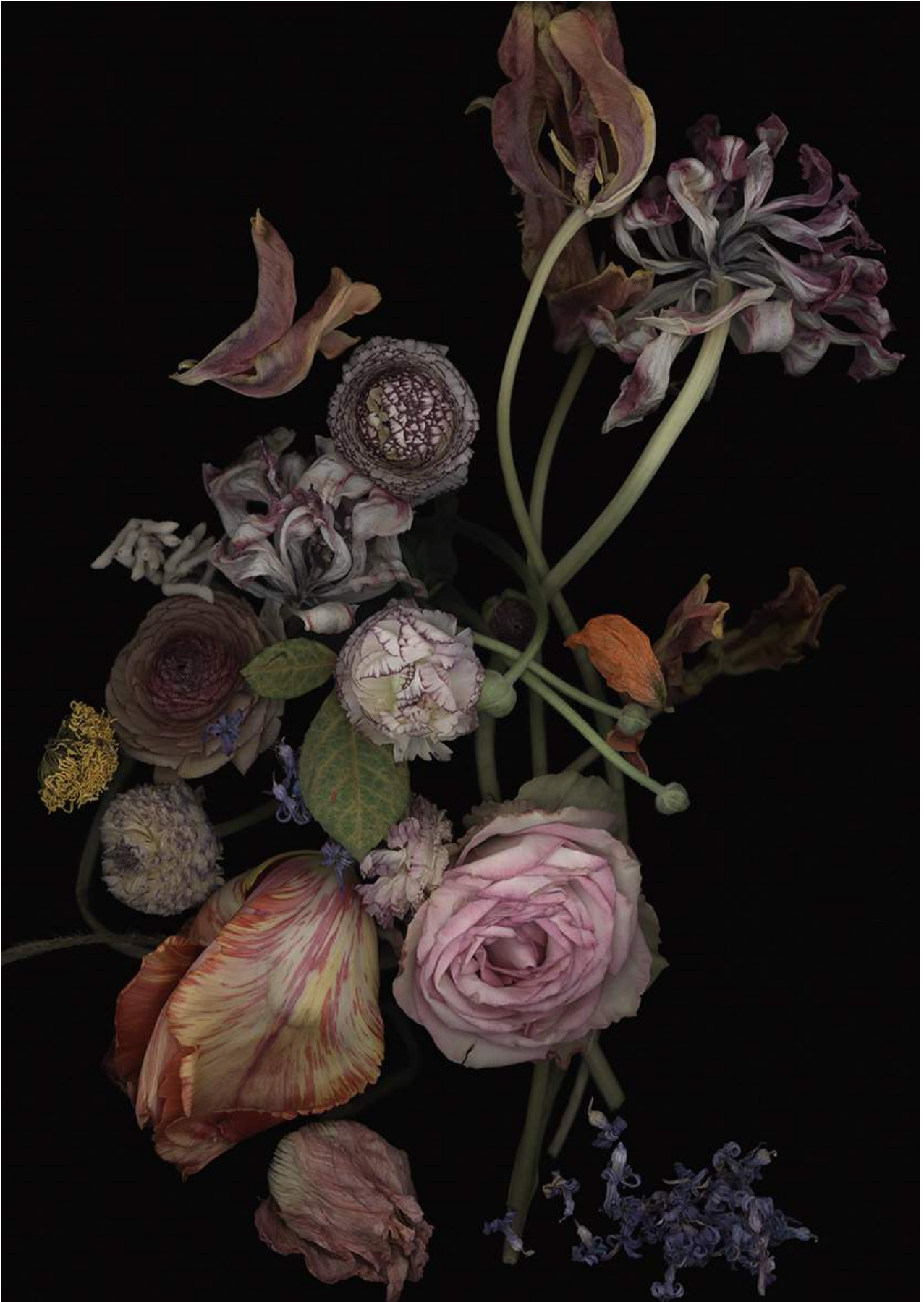
Stockage 210, 2024, Scannogramm, Inkjetprint auf Photo Rag, gerahmt mit Nussholz, 70 x 50 cm, Ed.15