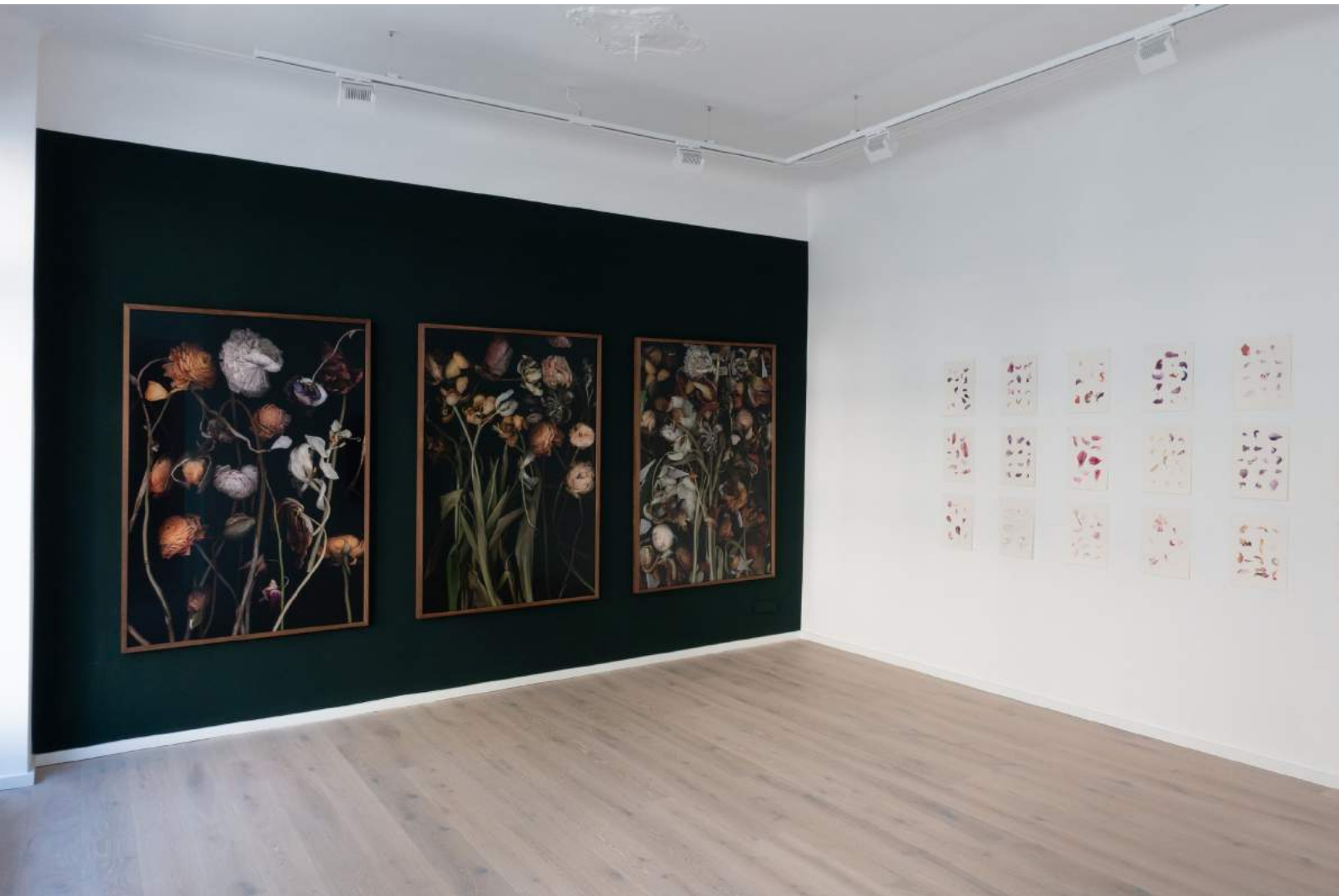
Stockage 182/183/184, 2019+ Stockage 210, 2024, Lightjetprint on Aludibond, gerahmt mit Nussholz, Ed. 5+ 1AP