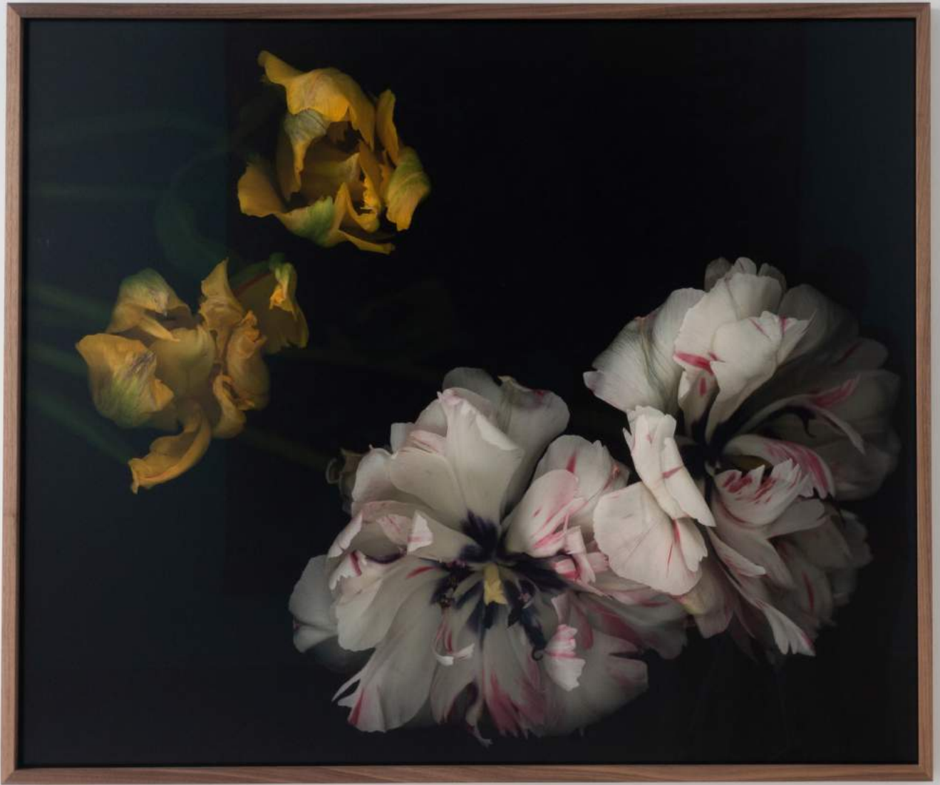
Stockage 211, 2024, Inkjetprint on Canson Platine Fibre Rag, gerahmt mit Nussholz, 130 x 100 cm, Ed. 6 + 1