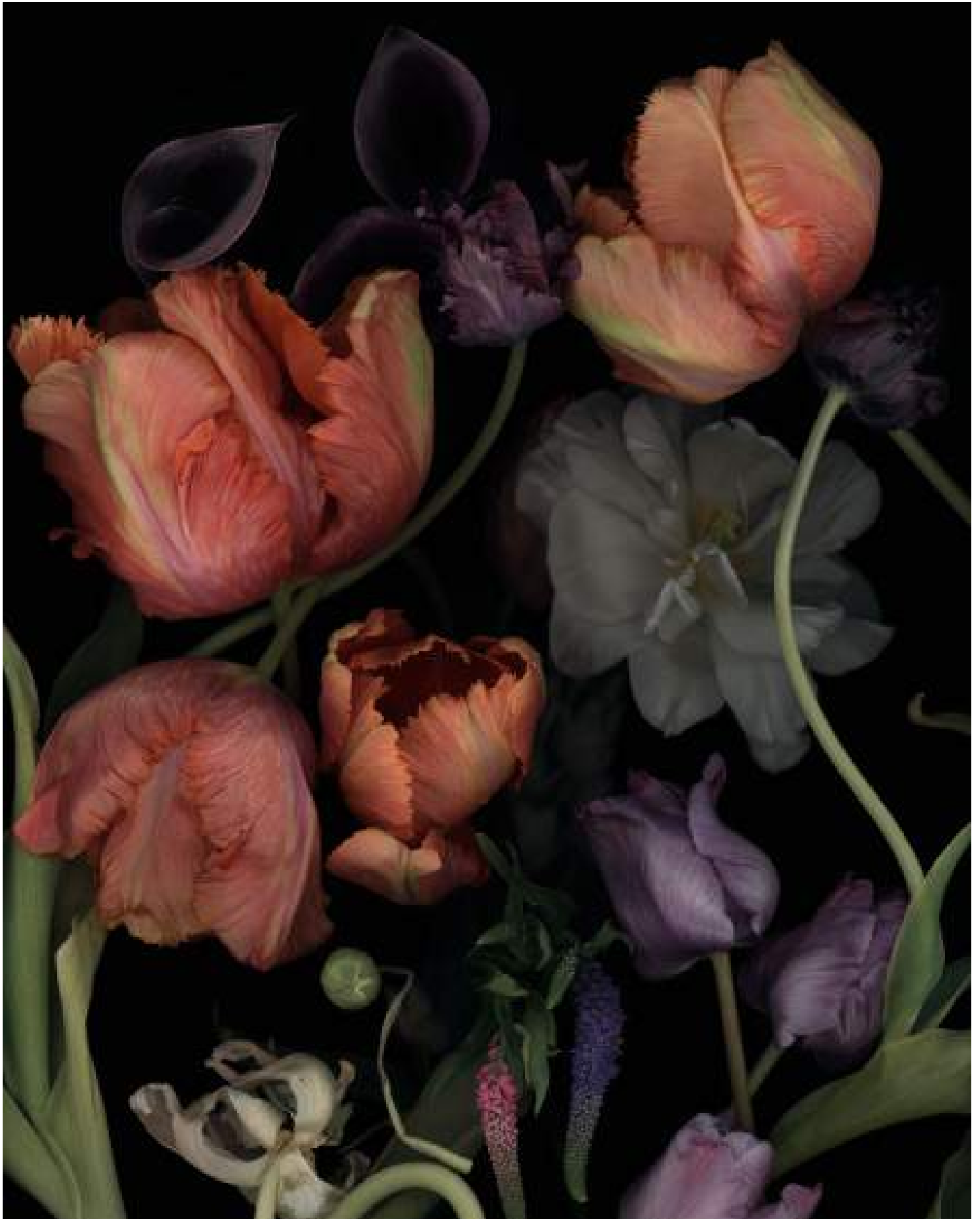
Stockage 195, 2021, Scannogramm, Inkjetprint auf Photo Rag, gerahmt mit Nussholz, 70 x 50 cm, Ed.15