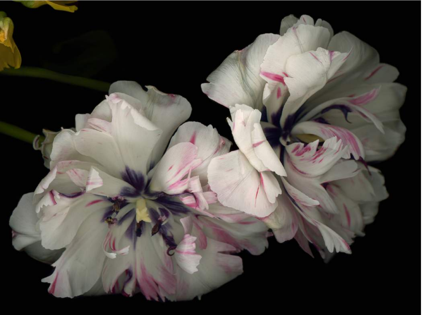
Stockage Scannogramme und andere Werke Abb. Detail Stockage 211, 2024