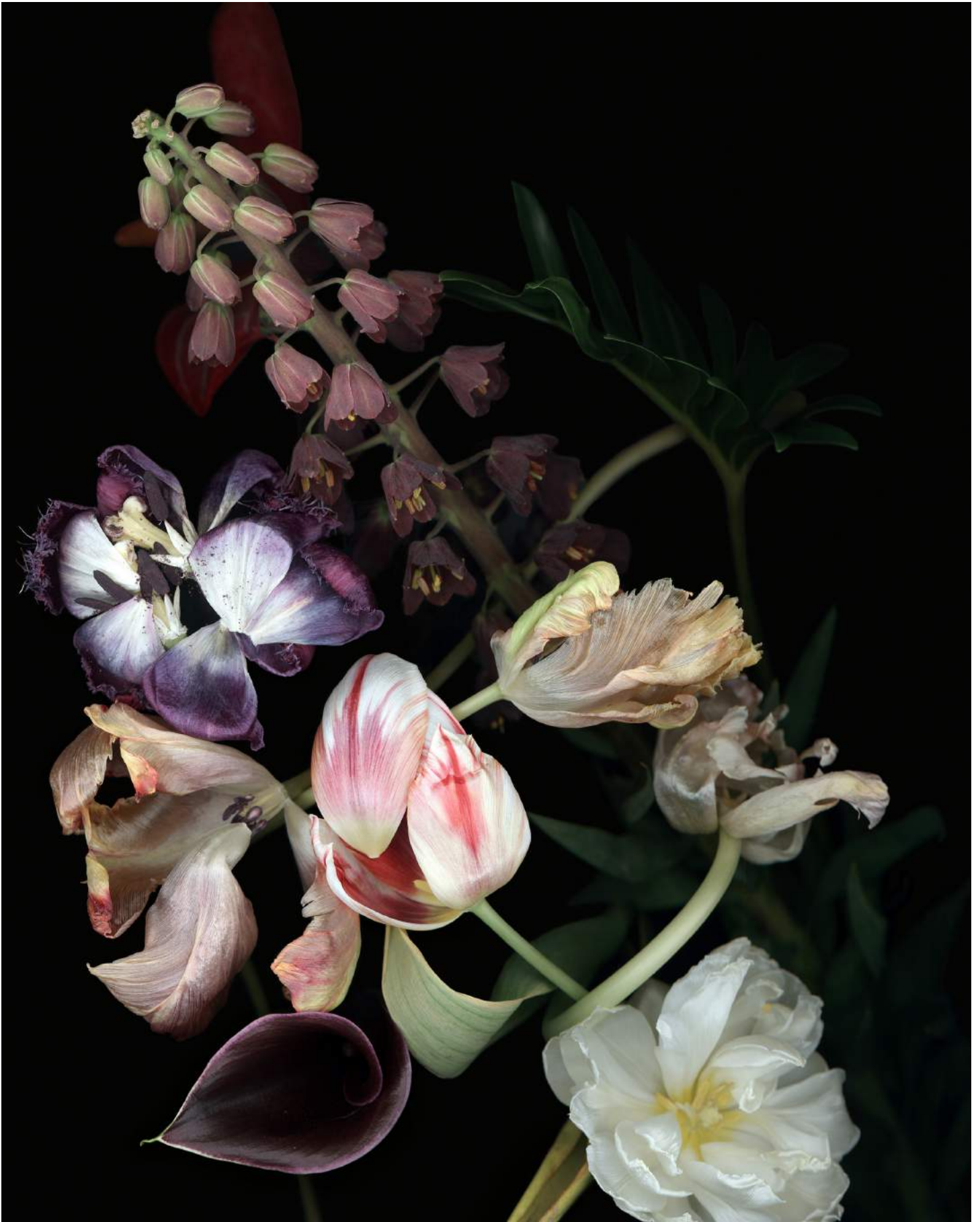
Stockage 192, 2021, Scannogramm, Inkjetprint auf Photo Rag, gerahmt mit Nussholz, 70 x 50 cm, Ed.15