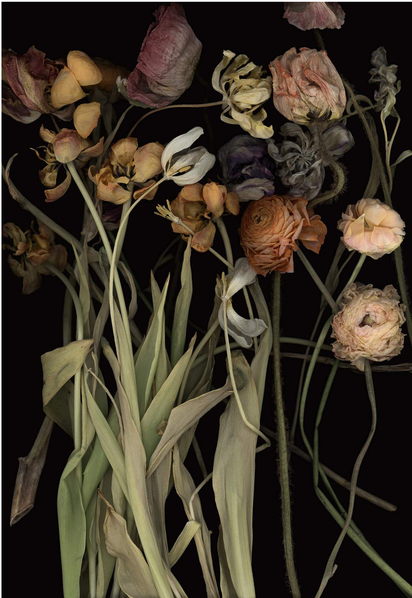
Stockage 183 2019, Inkjetprint auf Canson Platine Fibre Rag, gerahmt mit Nussholz, 181 x 126 cm, Ed. 5/5+1 AP