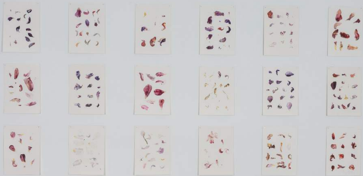
Aquarelle auf Arches Papier, 2023 à 36 x 26 cm