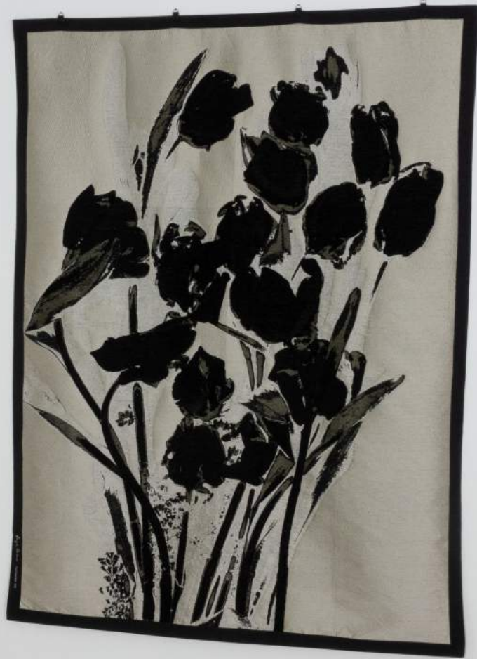
Untitled, 2022, Tapisserie, 212 x 155 cm, Unilkat