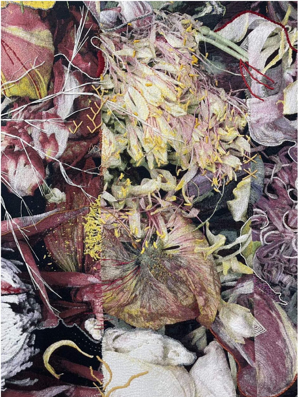
Detail von „Tendenz Endlos, 2019-2022, Tapisserie mit Stickerei, 284 x 280 cm, Unilkat“