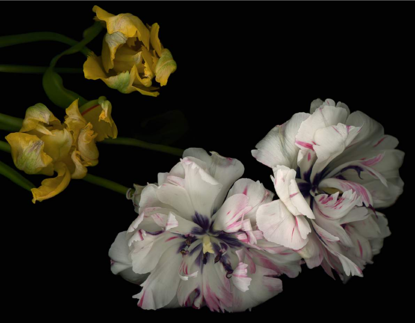
Stockage 211, 2024, Inkjetprint on Canson Platine Fibre Rag, gerahmt mit Nussholz, 130 x 100 cm, Ed. 6 + 1