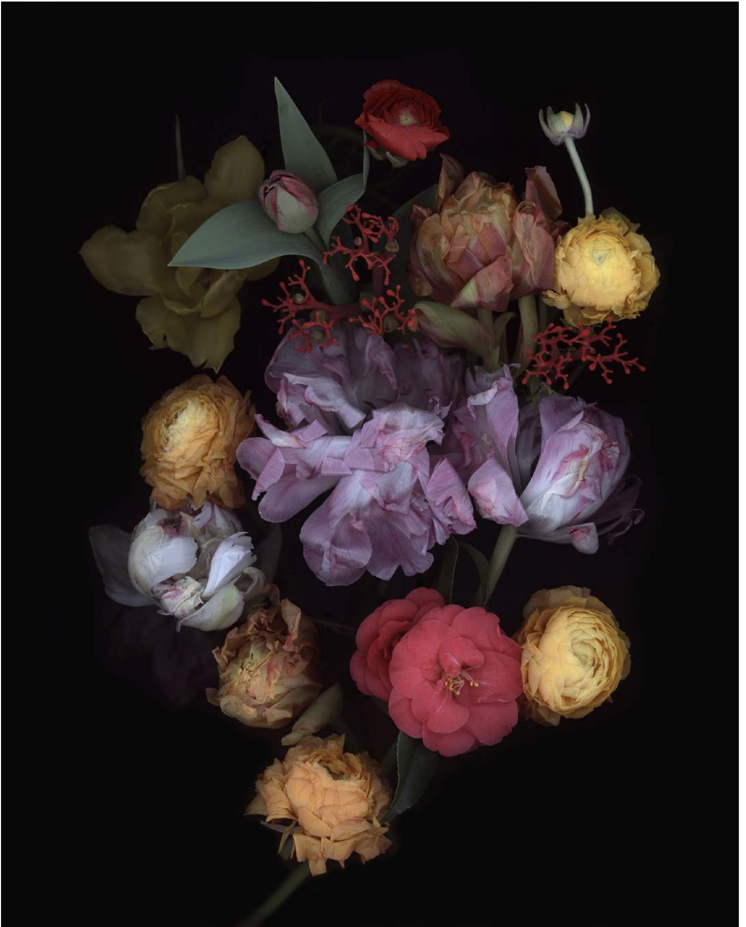
Stockage 212, 2024, Inkjetprint auf Canson Platine Fibre Rag, gerahmt mit Nussholz, 100 x80 cm, Ed. 5+1 AP