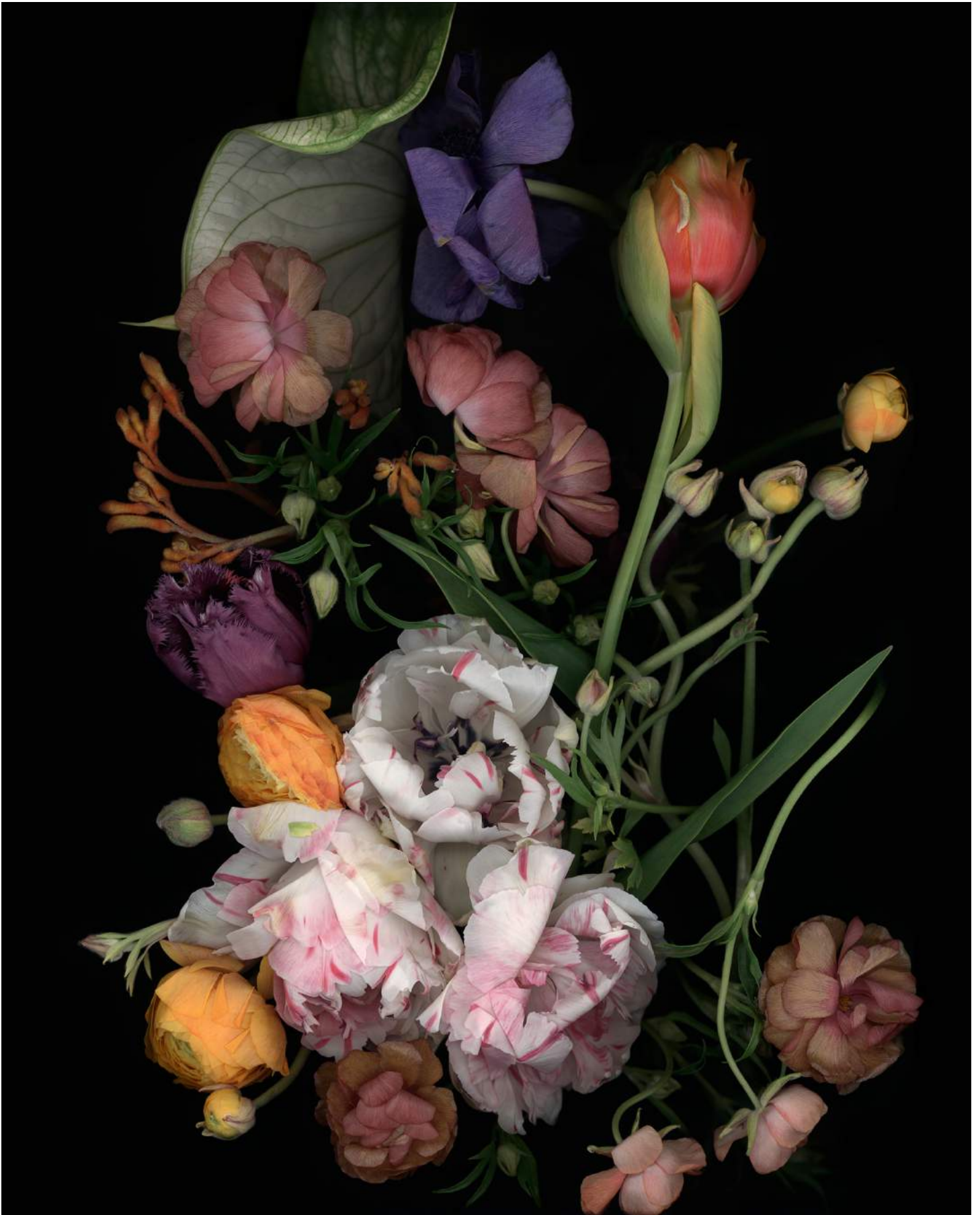
Stockage 213, 2024, Inkjetprint auf Canson Platine Fibre Rag, gerahmt mit Nussholz, 100 x 80 cm, Ed. 5+1 AP