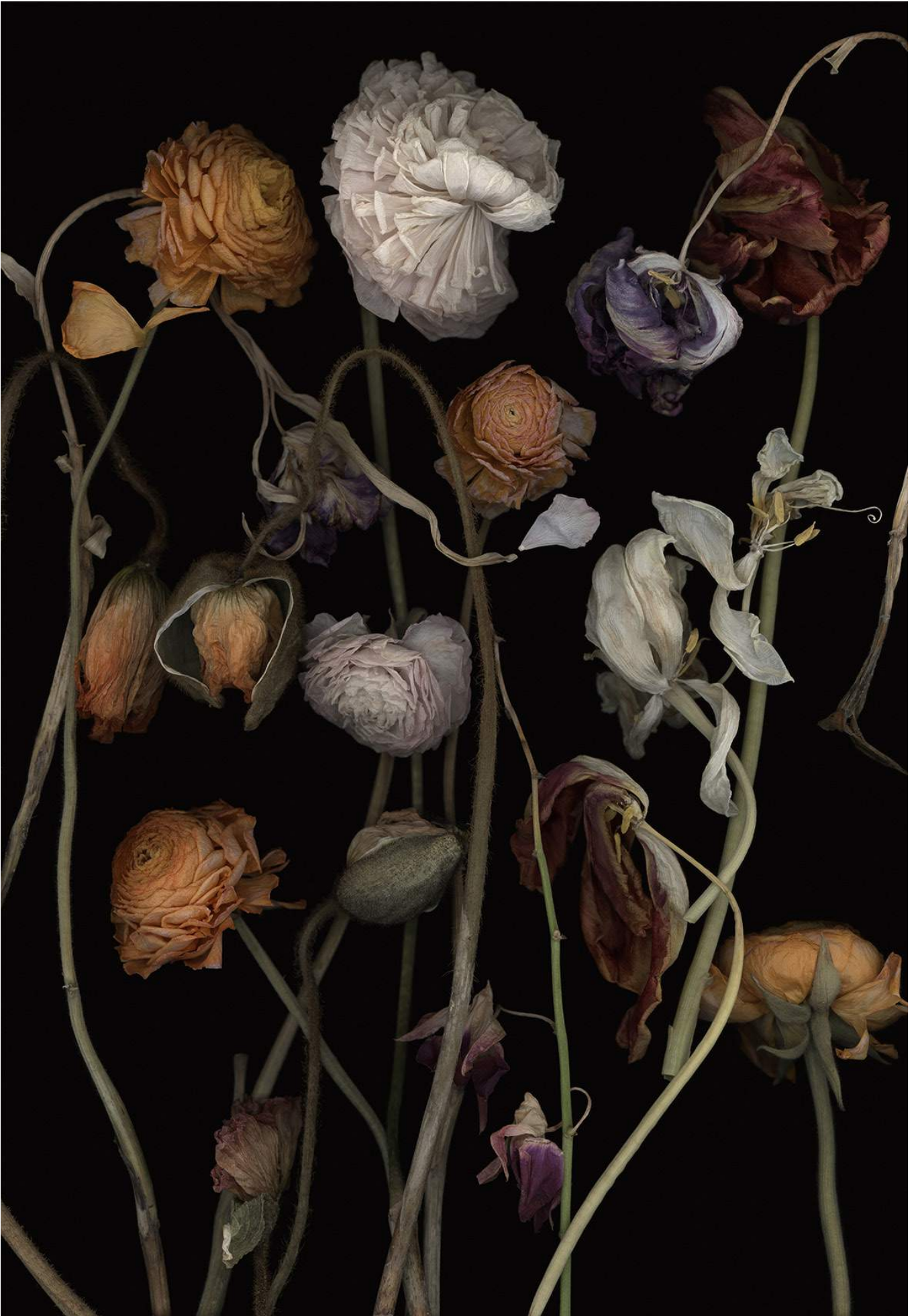
Stockage 182 2019, Inkjetprint auf Canson Platine Fibre Rag, gerahmt mit Nussholz, 181 x 126 cm, Ed. 3/5+1 AP