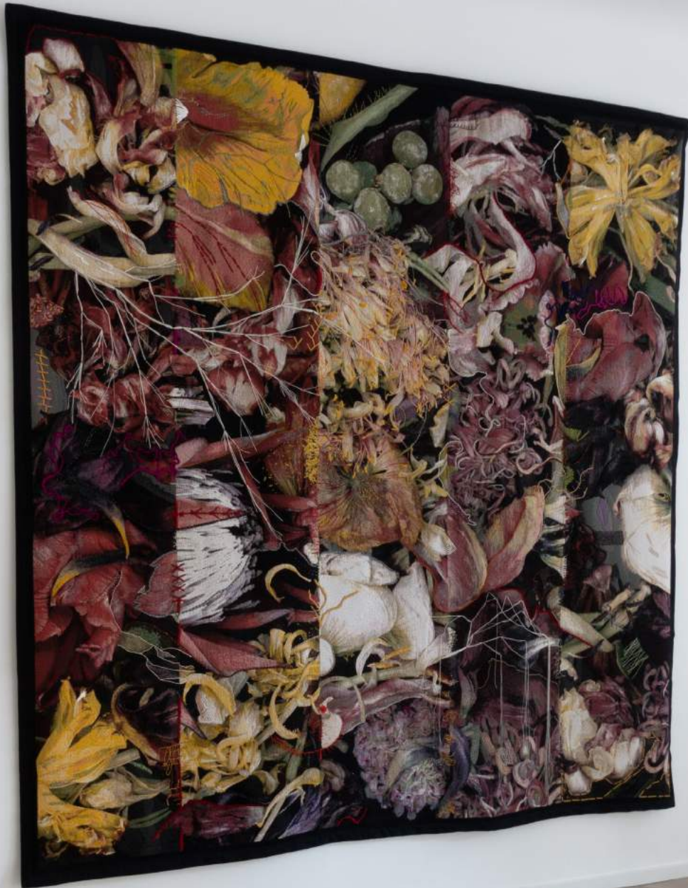
Tendenz Endlos, 2019-2022, Tapissérie mit Stickerei, 284 x 280 cm, Unilkat