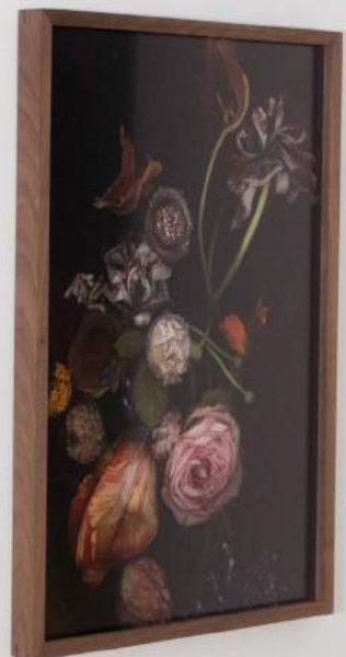
Stockage 189, 2022 + Stockage 210, 2024, Inkjetprint auf Canson Platine Fibre Rag, gerahmt mit NusshoEd. 15+1 AP