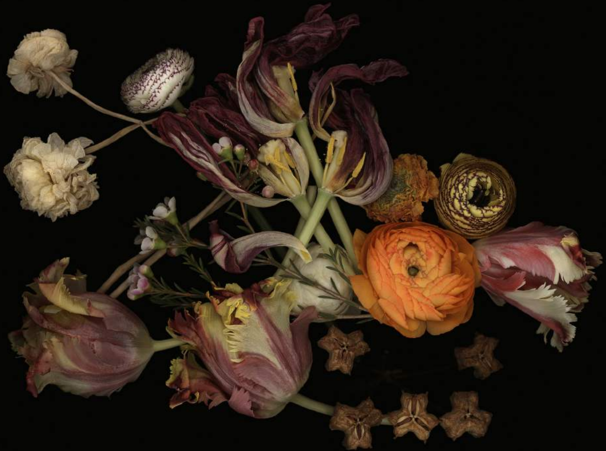
Stockage 187, 2020, Inkjetprint on Aludibond, gerahmt mit Nussholz, 142 x 200cm, Ed. 6 + 1 AP