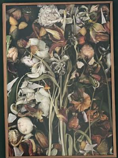
Stockage 182/183/184, 2019+ Stockage 210, 2024, Lightjetprint on Aludibond, gerahmt mit Nussholz, Ed. 5+ 1AP