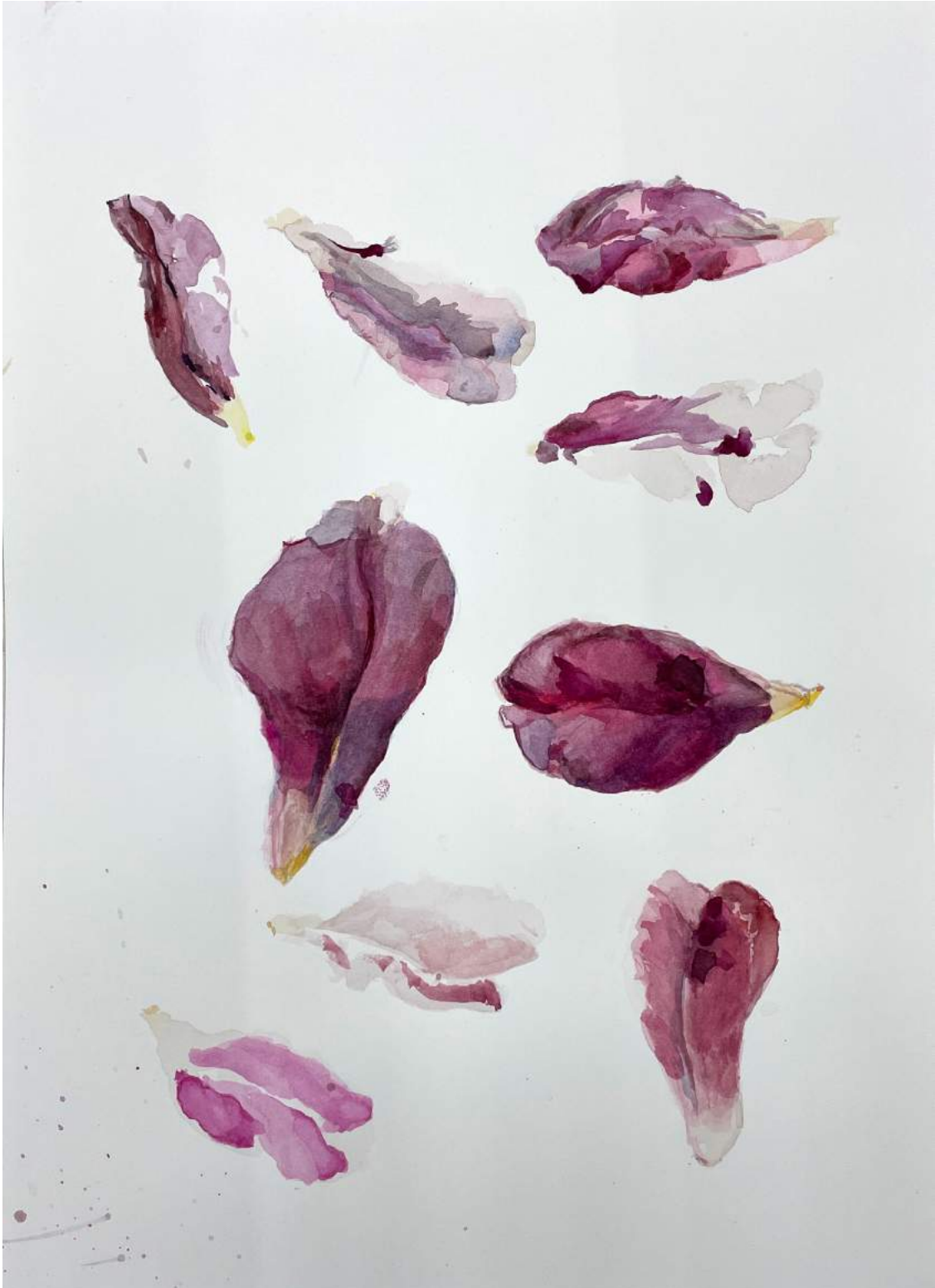
Ohne Titel, # 14, 2023, Aquarell auf Arches Papier, 36 x 26 cm