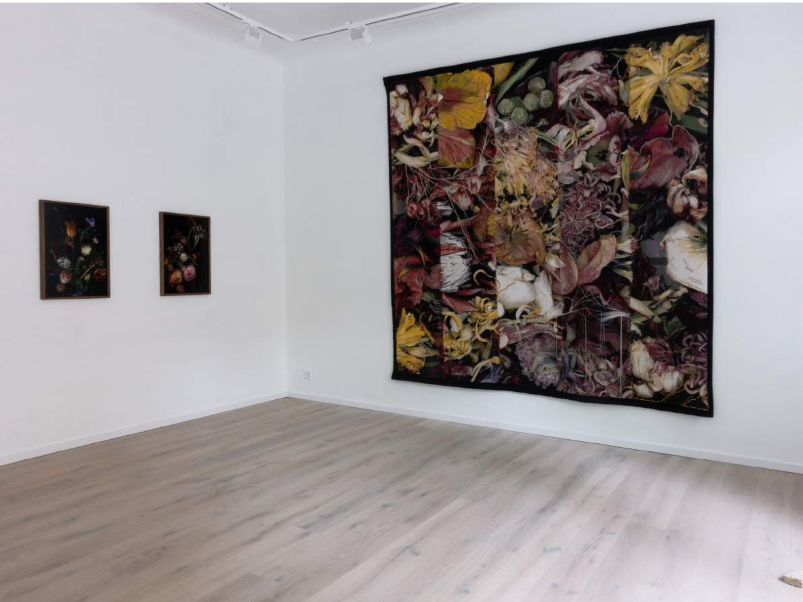
Stockage 189 +210 + Tendenz Endlos, 2019-2022, Tapisserie mit Stickerei, 284 x 280 cm, Unilkat