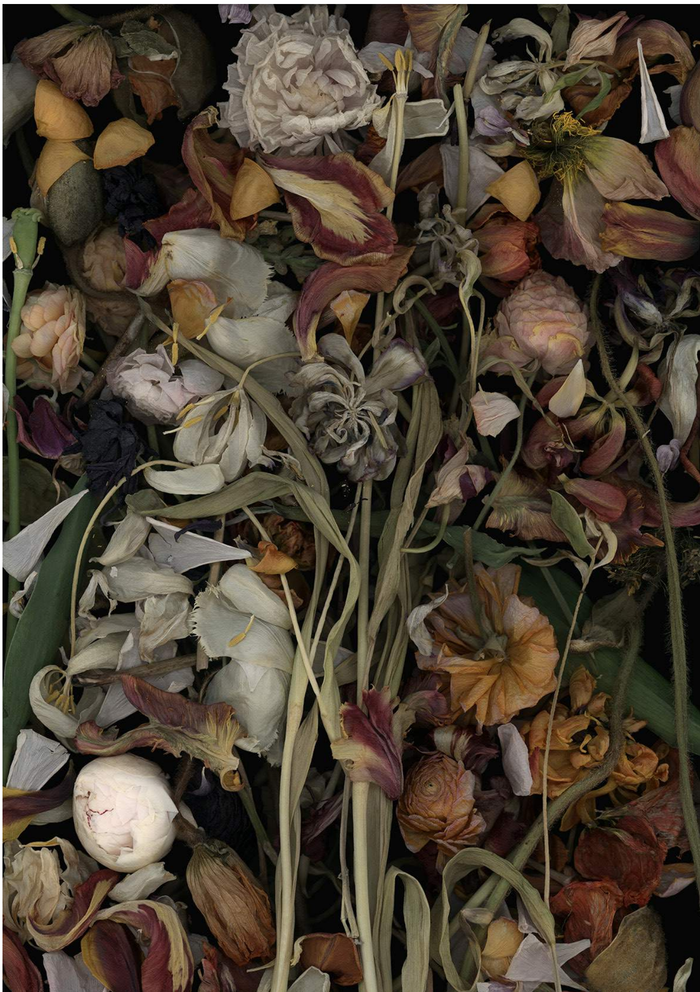
Stockage 184, 2019, Inkjetprint auf Canson Platine Fibre Rag, gerahmt mit Nussholz, 181 x 126 cm, Ed. 5, /5+1 AP