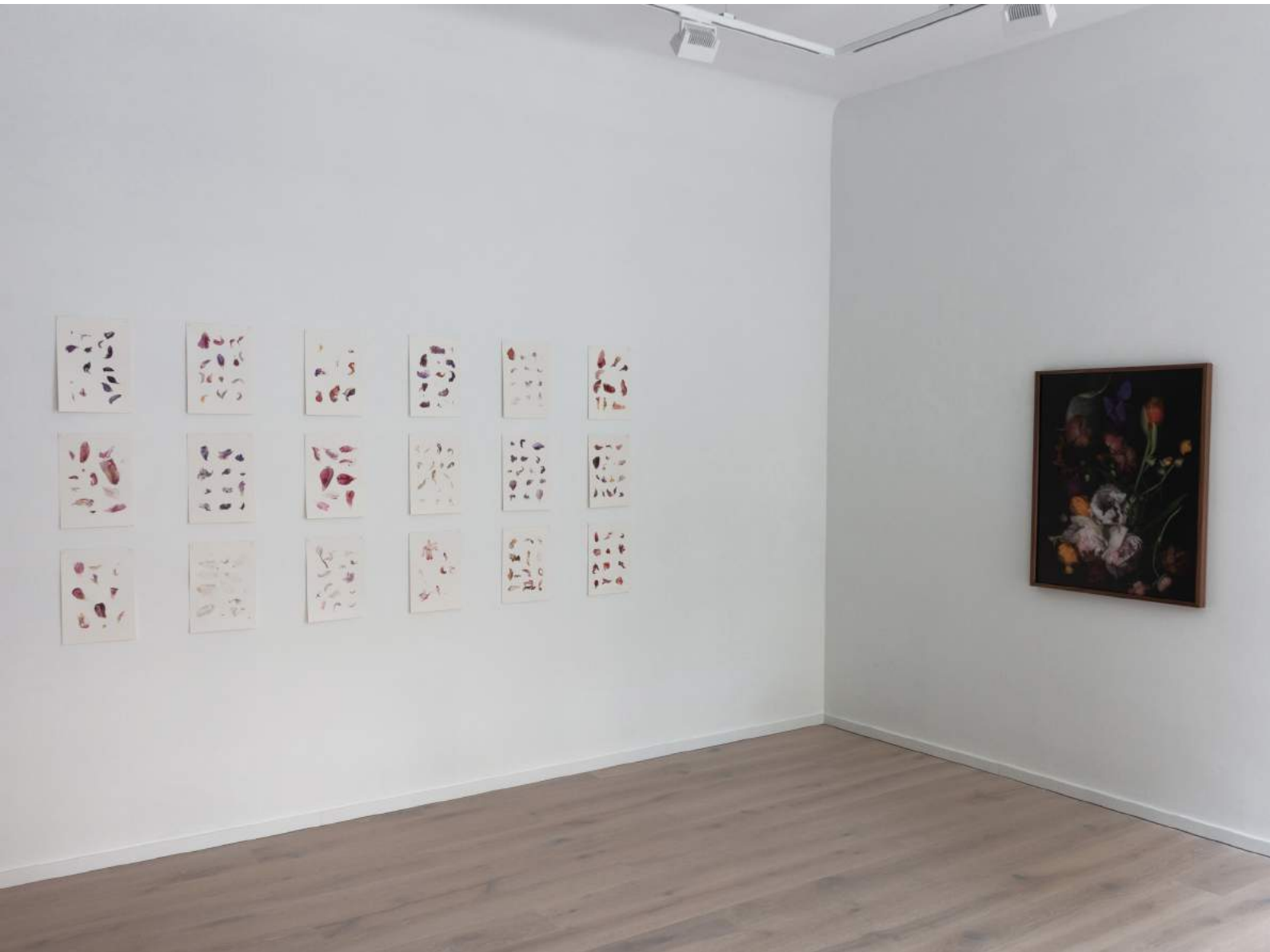
Stockage 213, 2024 und Aquarelle auf Arches Papier, 2023 à 36 x 26 cm